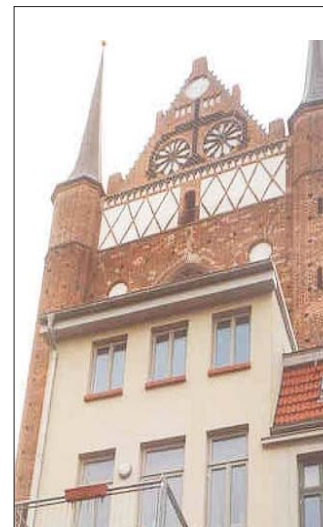
Moderner Wohnraum mit historischem Ambiente in der Altstadt von Wismar

Für 2008 wird eine Internationale Bauausstellung in Wismar vorbereitet. Arbeitsthema ist „Historische Stadt und neues Wohnen“; eine Bauausstellung zu aktuellen Möglichkeiten des attraktiven Wohnungsbaus in der Stadt.