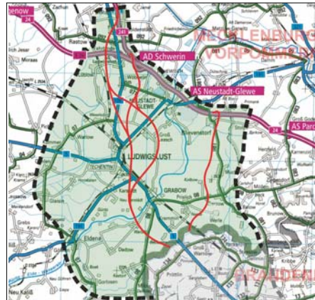
Untersuchungsraum mit Trassenvarianten

Für den Neubau der A 14 Magdeburg-Wittenbergschwerin bedeutet das die Untersuchung folgender Trassenvarianten (rote Linienführung).