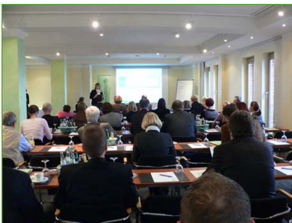
Vertreter der Gesundheitswirtschaft beim Workshop