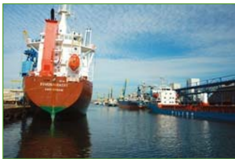
Blick auf die Stück- und Massengutterminals des Seehafens Wismar

Der aktuellen Seeverkehrsprognose zufolge, soll sich der Umschlag im Seehafen Wismar bis 2025 mehr als verdoppeln. Bereits heute stößt der Seehafen Wismar mit dem verfügbaren Flächenangebot an seine Grenzen. Vor diesem Hintergrund besteht die dringende Notwendigkeit für den Seehafen Wismar ein Regionales Flächenvorsorgekonzept zu erarbeiten, um künftig auf die unterschiedlichsten hafenaffinen Flächennachfragen von Investoren vorbereitet zu sein und um damit die Wirtschaftskraft der ganzen Region zu stärken.