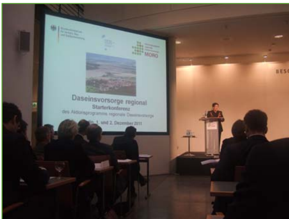
Frau Prof. Dr. Rita Süßmuth auf der Starterkonferenz

Frau Prof. Dr. Rita Süßmuth, Vorsitzende der Bewertungskommission, verwies auf den interdisziplinären Ansatz des Projektes. Unter Mitwirkung einer breiten Akteursbeteiligung sollen regionale Stärken gefördert und neue Perspektiven zur Verbesserung der Lebensqualität eröffnet werden.