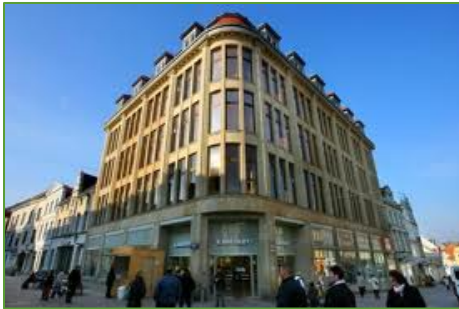
Stammhaus von Karstadt in Wismar

Einzelhandelsstruktur inklusive der einzelhandelsaffinen Dienstleistungsstrukturen in der Kernstadt Hansestadt Wismar und in den Umlandgemeinden. Das Auftragsvolumen umfasst 29.631 €.