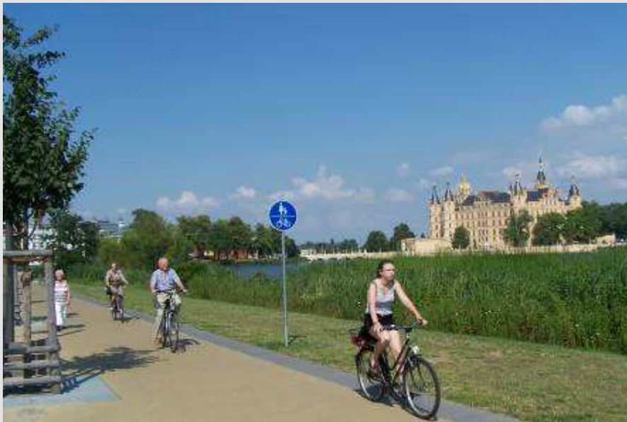
Schlosspromenade an der Graf-Schack-Allee